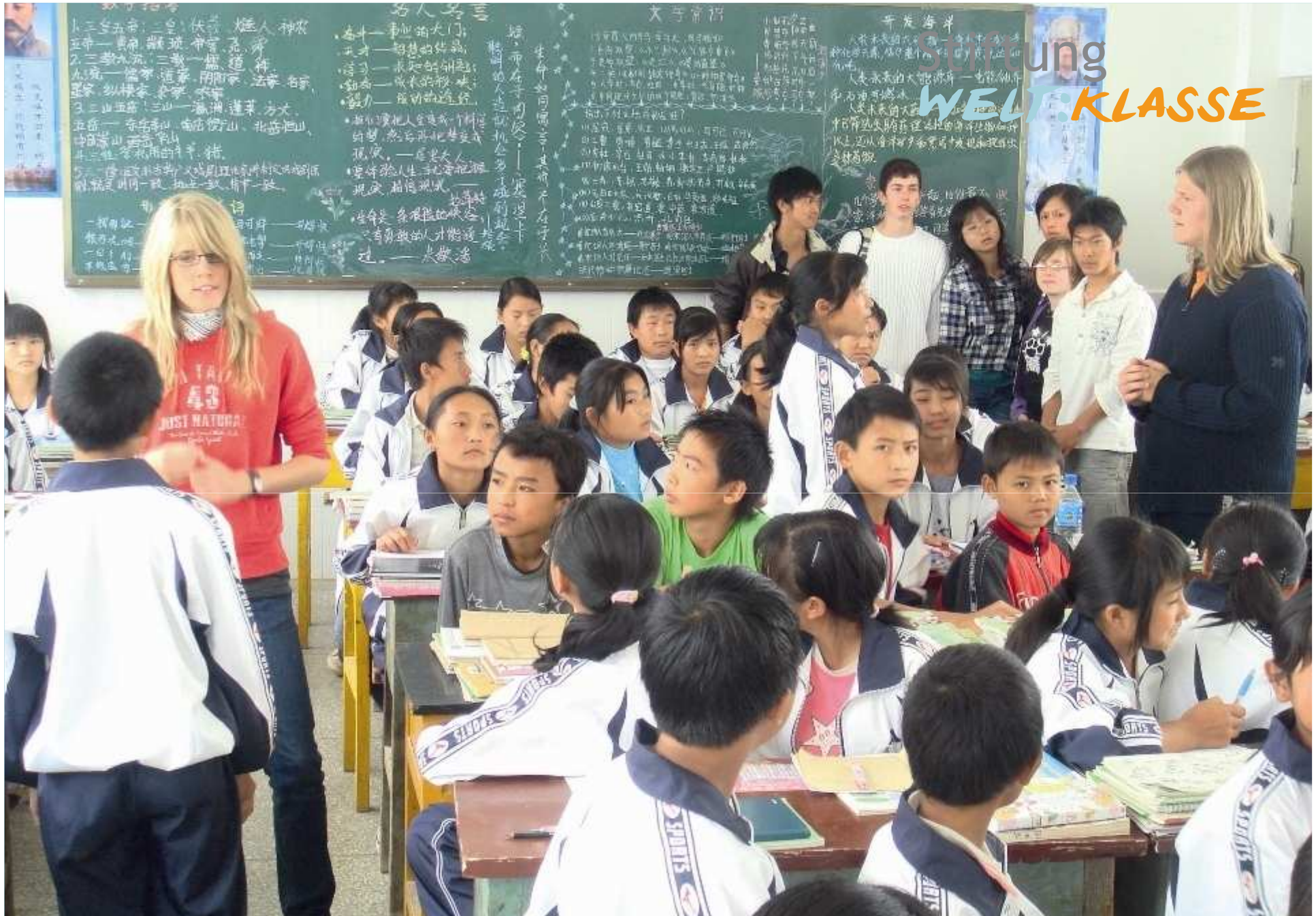
Weit:Klasse-Schüler besuchen eine Schule in Dali, China