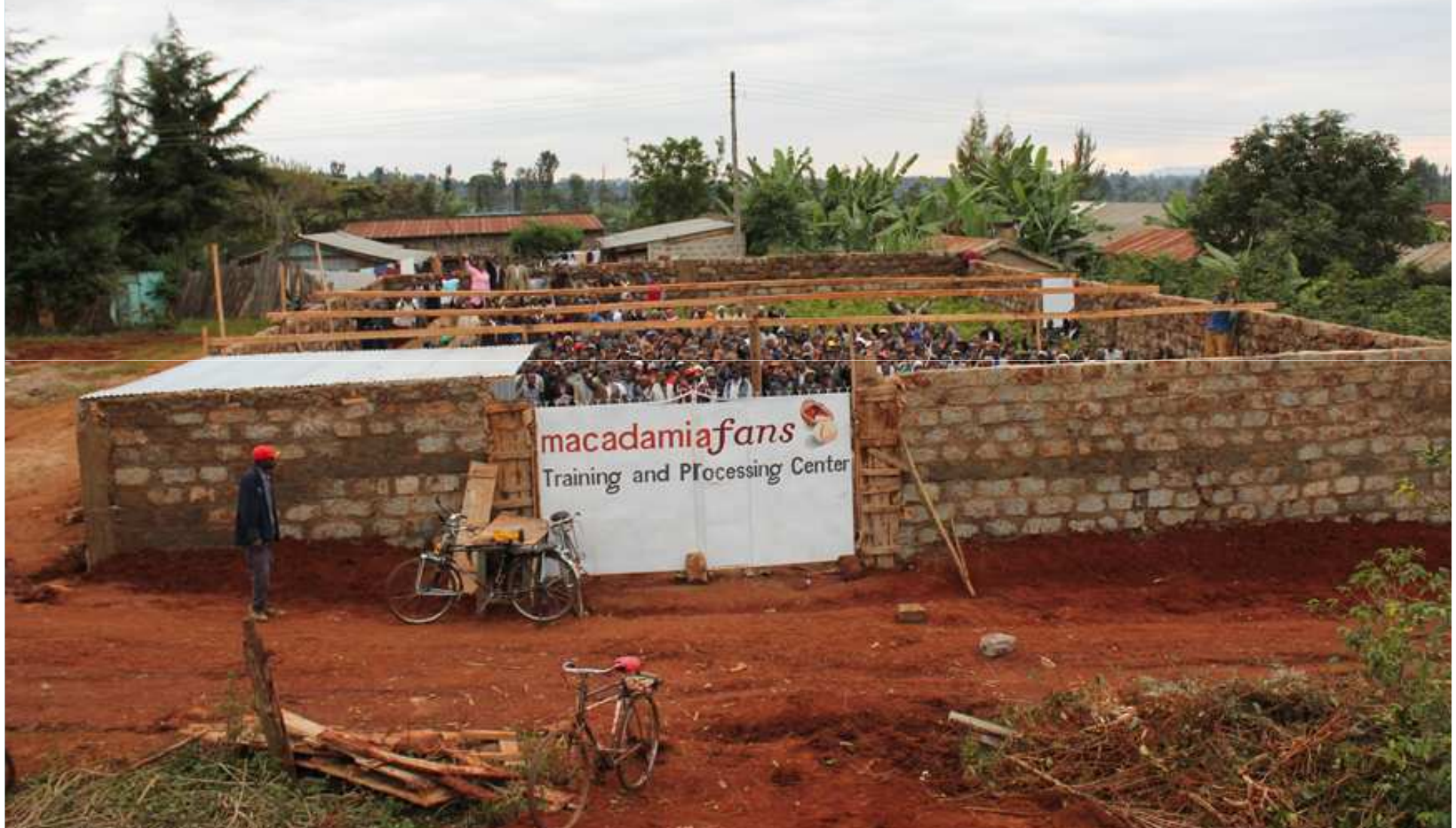
Nachhaltige Wertschöpfungskette für Bio-Macadamia-Nüsse aus Kenia