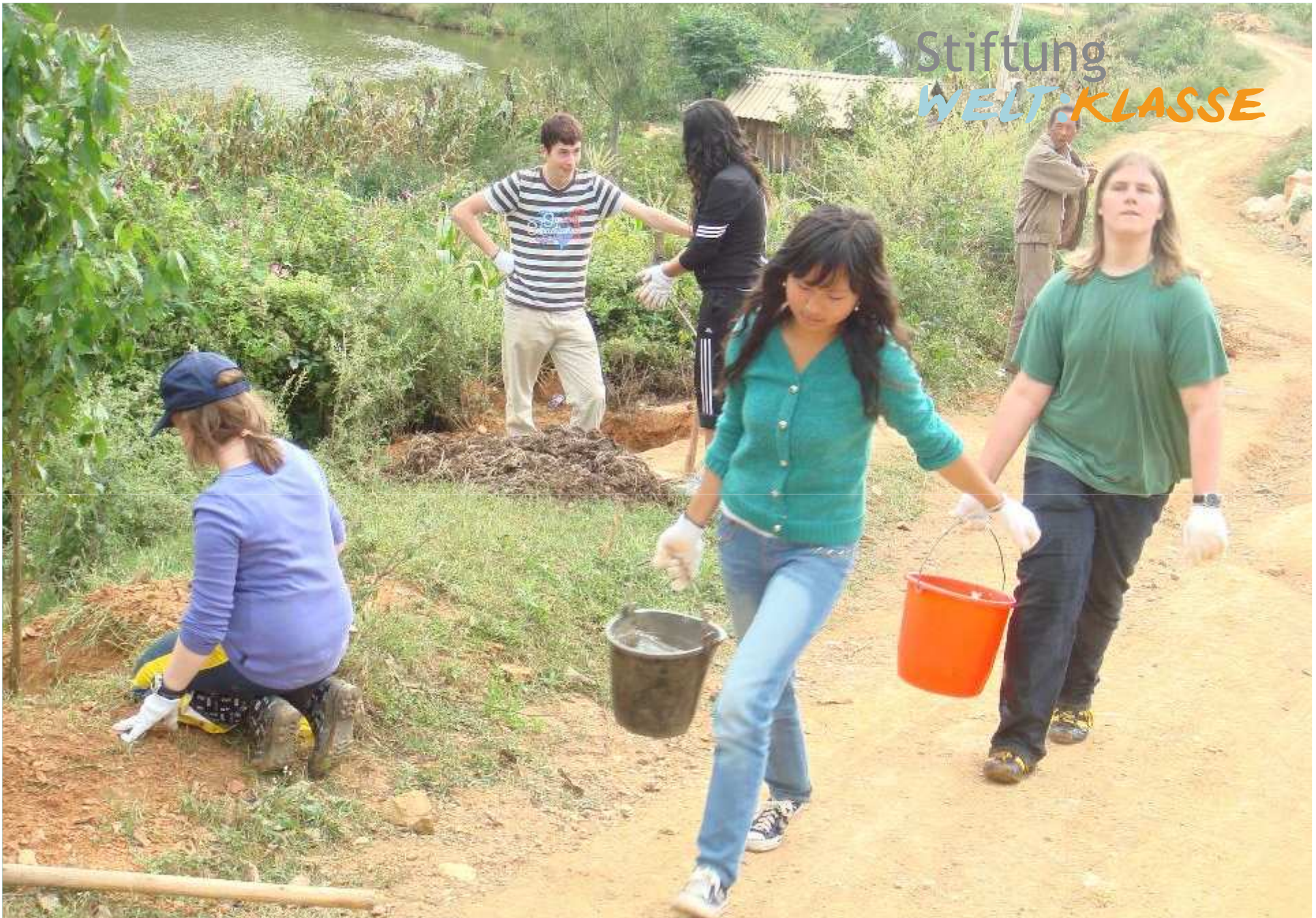
Arbeit an einem Wiederaufforstungsprojekt in China mit chinesischen Jugendlichen