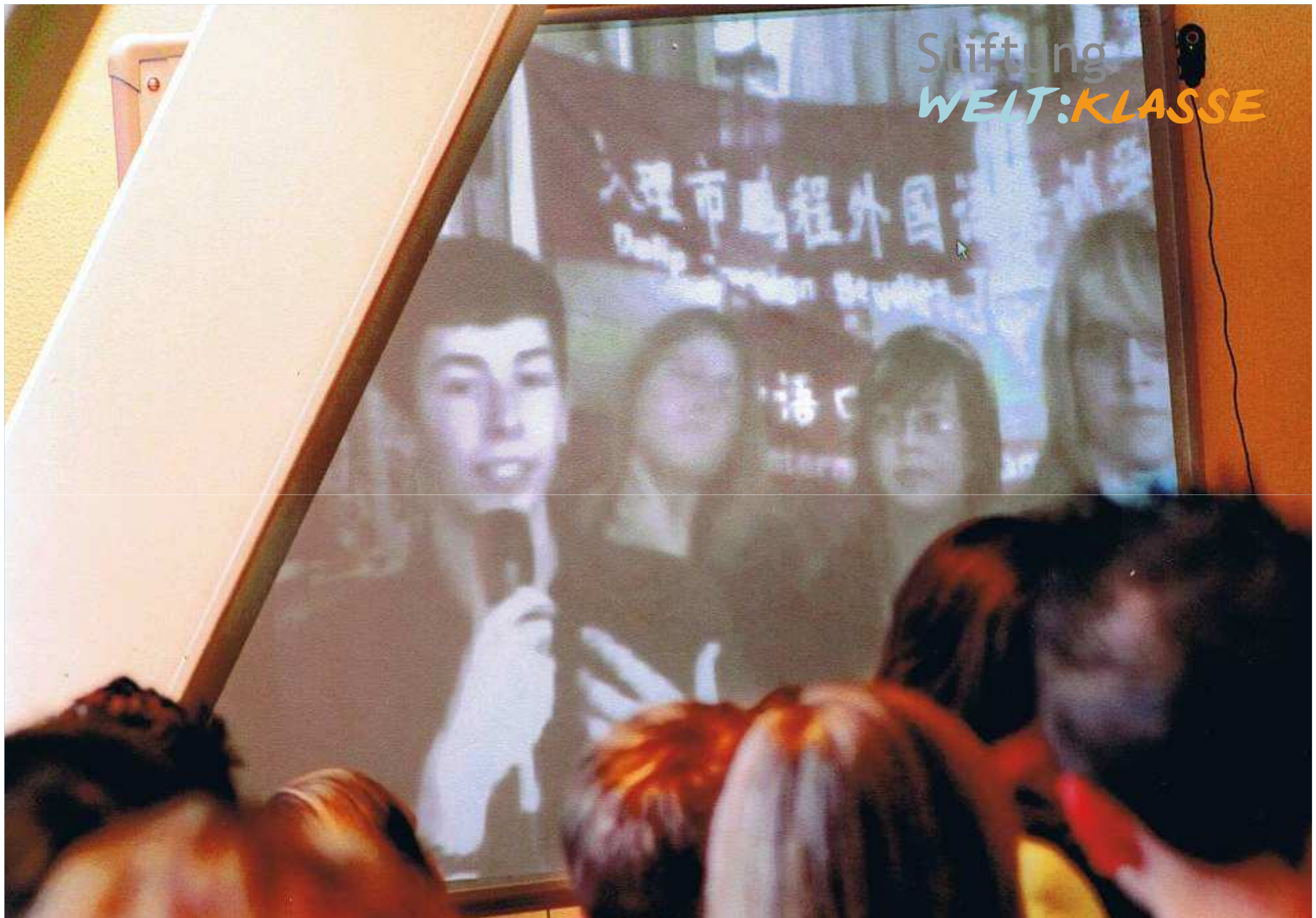
Bericht aus China per Videokonferenz an die Schulgemeinde in Deutschland