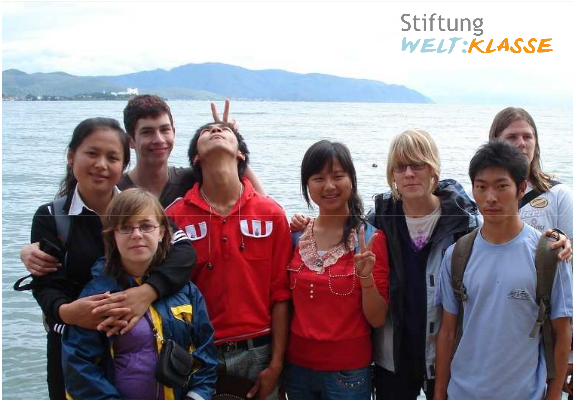
Deutsch-chinesisches Team am Erhai-See bei Dali, China